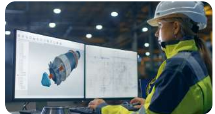
Formation sur votre site

“POUR APPRENDRE À PROGRAMMER IL FAUT PRATIQUER, C’EST LA CLÉ” PEU IMPORTE LE LIEU DE LA FORMATION, CHEZ CODA, L’ACCENT EST MIS SUR LA PRATIQUE.