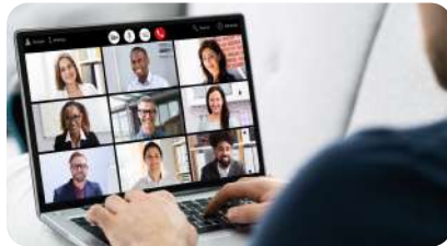
Formation en classe virtuelle